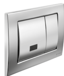
MONTUS FIELD E